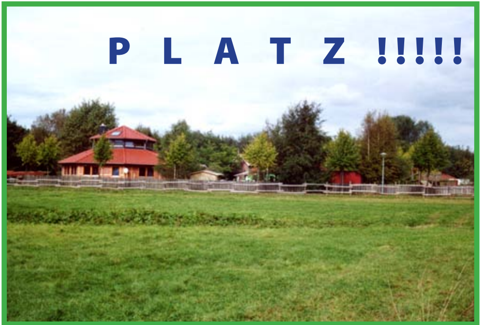
Außenansicht der Kinder- und Jugendfarm Bremen-Haben- hausen

Zu groß kann das Grundstück gar nicht sein: dessen Größe bestimmt die Tierauswahl. Die Haltung von Ponys und Eseln ist nur möglich, wenn geeignete Freiflächen vorhanden sind.